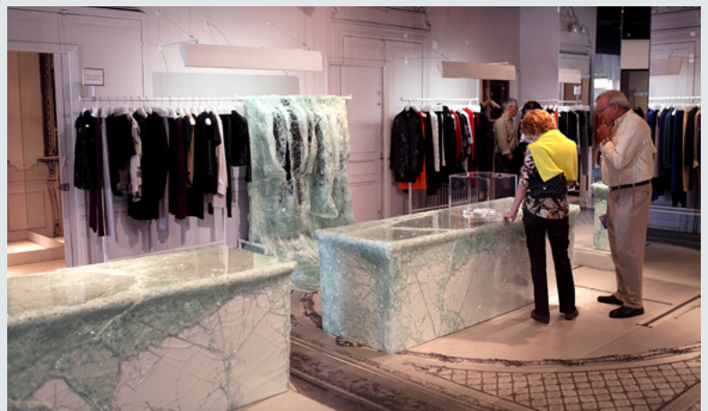
Baptiste Debombourg: „Stalker“, 2013. Contextual laminated glass installation in Maison Martin Margiela Miami & Atelier Swarovski. Art Basel Miami art Fair outdoor, USA, variable size group of element, portique 173x154x51 cm, two monobloc pedestal 74x74x240 cm, ground installation 630x150x3 cm, courtesy Krupic Kersting Gallery, Cologne, Germany

We have an extremely varied audience, around 8000 persons a year. Our program is organized so that everyone who visits will experience a variety of activities, meet an artist at work, see an exhibition and/or participate in a creative activity. We have invited thirty-eight artists to our residency program since it started in 2011. Many of these artists have exhibited the results of their stay at S12 and elsewhere.