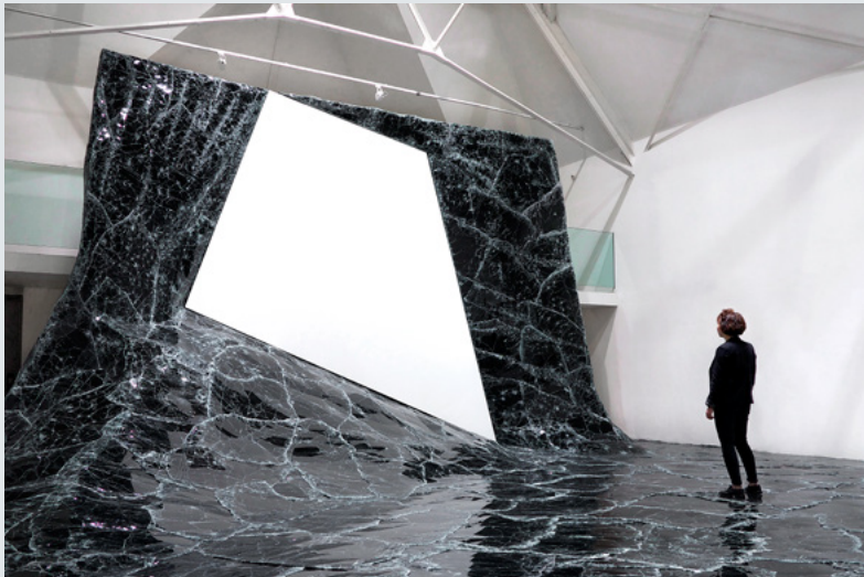
Baptiste Debombourg: „Dark matter“, la Chaufferie - Hear, Strasbourg, France, 2015. Contextual installation in black glass, 11x8x5 m, courtesy Krupic Kersting Gallery, Cologne, Germany