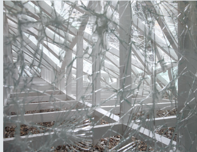
Baptiste Debombourg: „Acceleration Field“, Le Patio, Fondation Antoine de Galbert, Maison Rouge, Paris, 2015 (detail view). Contextual installation in laminated glass, 11x7x1,8 m, courtesy Galerie Patricia Dorfmann, Paris, France

Wie kam es, dass Sie den französischen Künstler Baptiste Debombourg eingeladen haben, eine Installation zum zehnjährigen Bestehen von S12 zu schaffen?