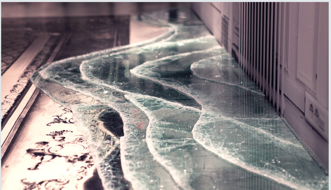
Baptiste Debombourg: „Stalker“, 2013 (detail view). Contextual laminated glass installation in Maison Martin Margiela Miami & Atelier Swarovski. Art Basel Miami art Fair outdoor, USA, variable size group of element, portique 173x154x51 cm, two monobloc pedestal 74x74x240 cm,ground installation 630x150x3 cm, courtesy Krupic Kersting Gallery, Cologne, Germany

He analyses and questions the meaning and sensibility of the actions we undertake, be they to construct or to