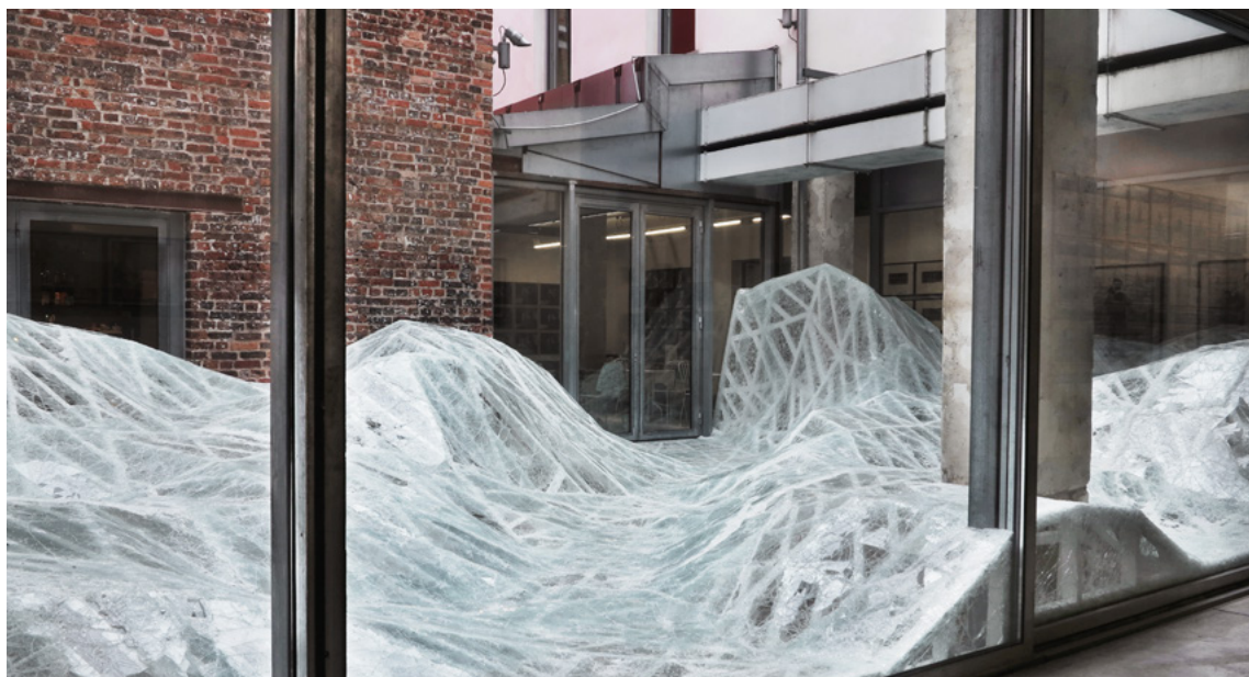
Baptiste Debombourg: „Acceleration Field“, 2015. Contextual installation in laminated glass, 11x7x1,8 m, Fondation Antoine de Galbert, Maison Rouge, Paris, courtesy Galerie Patricia Dorfmann, Paris, France

der Eindruck von Machtlosigkeit, wobei die Individuen selbst sowohl das zerbrechliche als auch das liebenswerte Wesen eines Menschen unterstreichen.