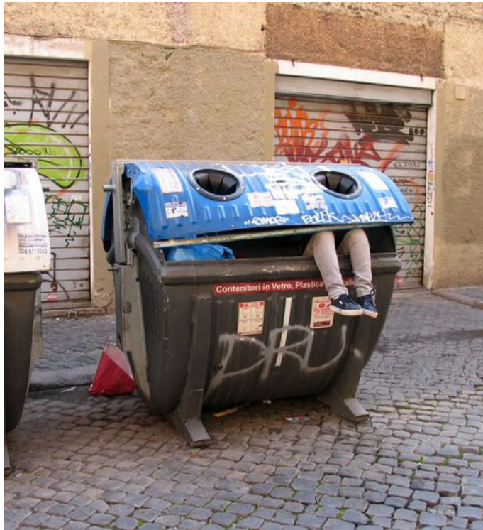
A Rome. - Mark Jenkins

Sur les trottoirs, dans les jardins publics, le street-artist installe des sculptures humaines qui interloquent.